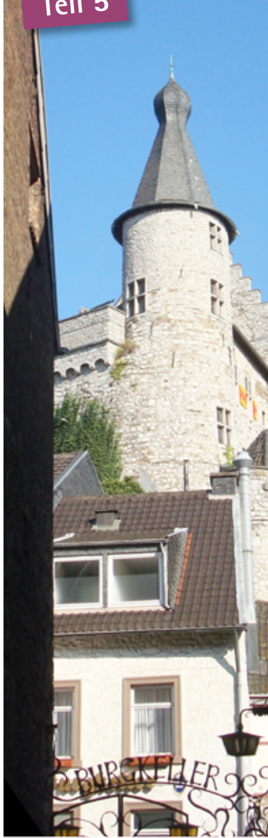
Blick von unten auf den Turm: die wenigsten machen sich über die beiden Obergeschosse Gedanken. Das Bürgermeisterzimmer befindet sich hinter den unteren Fenstern. Die oberen verbergen unübersehbar hoch über der Stadt den verborgenen Ort.