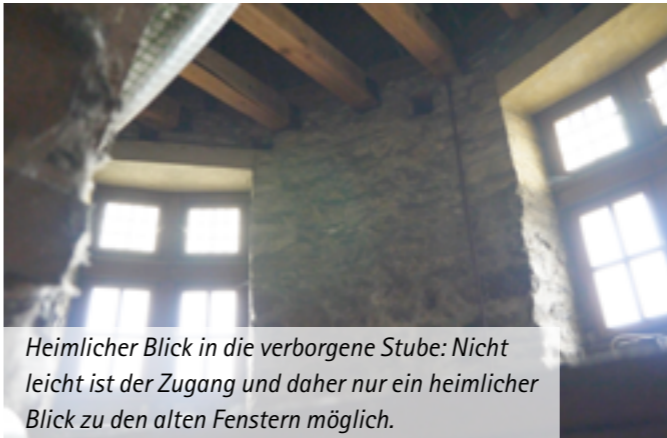
Heimlicher Blick in die verborgene Stube: Nicht leicht ist der Zugang und daher nur ein heimlicher Blick zu den alten Fenstern möglich.

Hoch über der Stadt, ein markanter Punkt über den Dächern der Altstadt, mit spitzer Haube bekrönt und doch ein unbekannter, unzugänglicher und verborgener Ort: die oberste Stube im Westturm der Burg. Seit Jahrzehnten tummeln sich hier nur Spinnen, die seit Arachnoiden-Generationen keine menschliche Ruhestörung fürchten müssen.