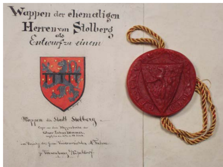
Originalentwurf für das Stadtwappen von 1880 (Stadtarchiv Stolberg, Bestand Stolberg 3281) und Siegelreproduktion einer Urkunde v. 12. März 1271 (StA Stolberg, Siegelsammlung)

ein Problem dieser Jahre. Ihn selbst gingen sie nicht an, aber der Landfriedensbund, den Aachen, Köln, Jülich und Brabant gegen freche Ritter gegründet hatten, machte in Stolberg kurzen Prozess. Man kam, sah und siegte: die Burg war geschleift, die Burgmänner vernichtet und Stolberg war nicht mehr. Weder Herrschaft noch Raubritternest. Für ein Menschenalter blieb der Burgfels öde und leer.