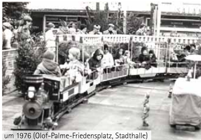
um 1976 (Olof-Palme-Friedensplatz, Stadthalle)

Das Angebot und die Nachfrage sind in diesen vierzig Jahren einem stetigen Wandel unterworfen und die Konkurrenz der mannigfaltigen Märkte ist eine Herausforderung für die Organisatoren. Die besondere Stolberger Kulisse des Kaiserplatzes, der Altstadt und der Burg suchen in der Euregio ihresgleichen und bieten einen gemütlichen Weihnachtsmarkt, der abwechslungsreich ist und von immer mehr Gästen geschätzt wird.