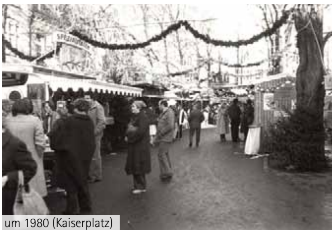
um 1980 (Kaiserplatz)

Die Anfänge waren 1976 bescheiden: einige Buden standen vor der Stadthalle und eine Eisenbahn drehte für die Kleinen ihre Runden. Zwei Jahre später wurden angeblich 200.000 Besucher gezählt – wider Erwarten, wie die Annalen betonen. Der Kaiserplatz bot nun die angemessene Kulisse für die ‚Kupferstädter Weihnachtstage‘ und auch die Burg wurde in das vorweihnachtliche Geschehen eingebunden.