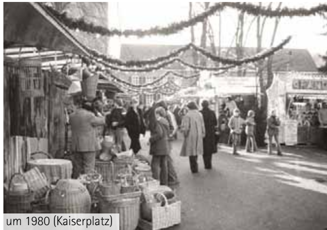
um 1980 (Kaiserplatz)

Im Jahr 1310 fand schon im fernen München ein Nikolausmarkt statt, der als mittelalterliche Frühform eines besonderen Marktes für den speziellen Bedarf vor den Weihnachtstagen gelten kann. Die alten Stolberger konnten von so einer Einrichtung nur träumen. Händler mit feinen Spezerien, handgefertigtem Spielzeug und anderen Luxusgütern verirrt sich nie in die Provinz und schon gar nicht aufs Land. Märkte und vor allem Weihnachts- oder Adventsmärkte waren großen Städten vorbehalten. Erst seit einer kurzen Spanne breiten sie sich als vorweihnachtliche Attraktion aus und sorgen für Trubel auch auf Stolbergs Straßen. Genau vor vierzig Jahren eröffnete Stolbergs erster Weihnachtsmarkt, kurz zuvor hatten es die Aachener vorgemacht.